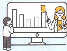
専門家の支援 市が費用の一部を補助します！