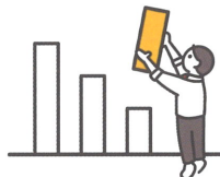
みなさまの主体的な取組