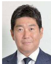
川崎市長 福田 紀彦

川崎市は、2050年の脱炭素社会の実現に向けて、令和2年11月12日に脱炭素戦略「かわさきカーボンゼロチャレンジ2050」を策定しました。特別対談では、2050年のCO 2 排出実質ゼロを表明した福田紀彦川崎市長と、川崎市国際環境施策参与を務め、日本と欧米の金融と環境問題に精通し、幅広く提言活動を行っている末吉竹二郎氏との対談を通して、脱炭素化へ向けた川崎市の意気込みや取組を発信するとともに、市民、事業者、行政が一丸となって具体的な行動実践に取り組むきっかけを探ります。