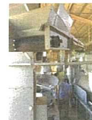
有機食品の製造ライン（茶葉→荒茶への製造ライン）