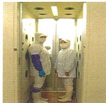
エアシャワー等の衛生管理設備の導入