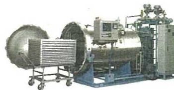
有害な微生物が産生する毒素を安全なレベルまで取り除く殺菌機の導入